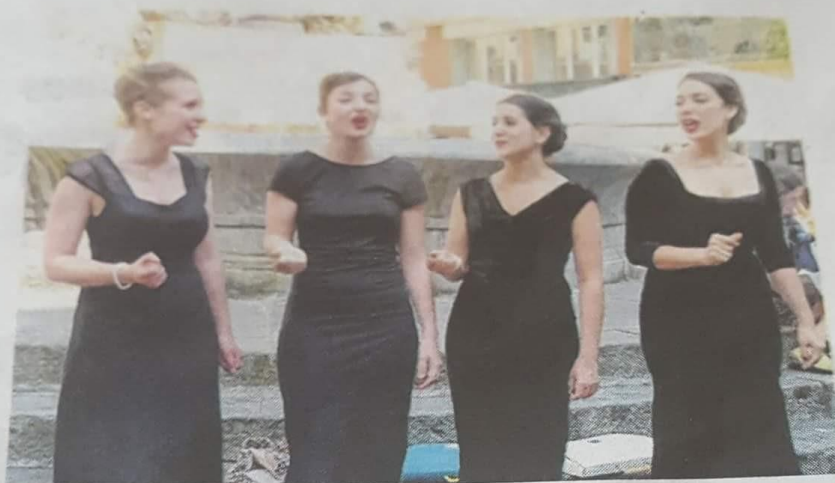
Les Divaskets étaient en résidence à Boussès.

ée de visite n Fédération ntale et de Comité dé- ne, sur dif- prétendre ergement bergeurs es condi- label, les istiques endroit riel, des nforma- bots de core... préten- fectué aires à rs en choix gage nnés H.A.