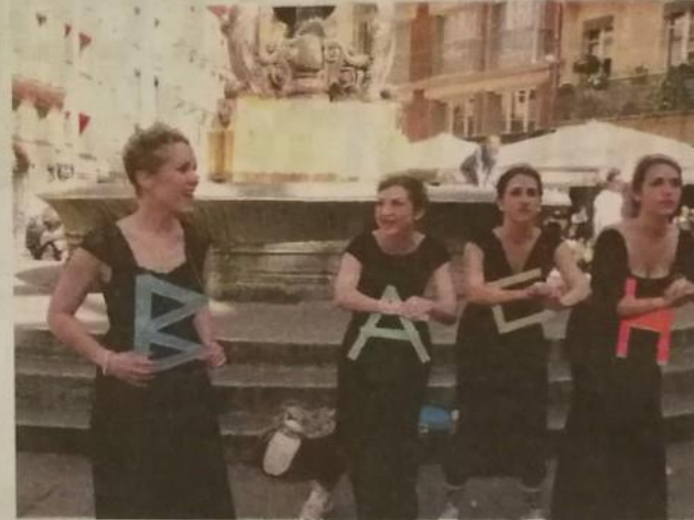
Elles viendront présenter « Bach to the future ».

Vous avez dit : « Boussès » ? Voilà le point de départ de « Bach to the future ». Le spectacle fait voyager durant une heure le public sur